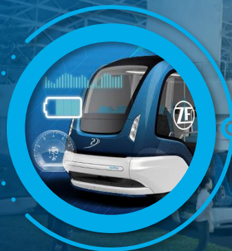
车队全时运行管理