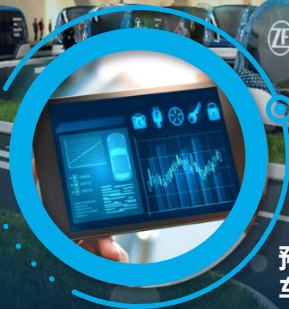
预防性与规范性 车辆服务解决方案